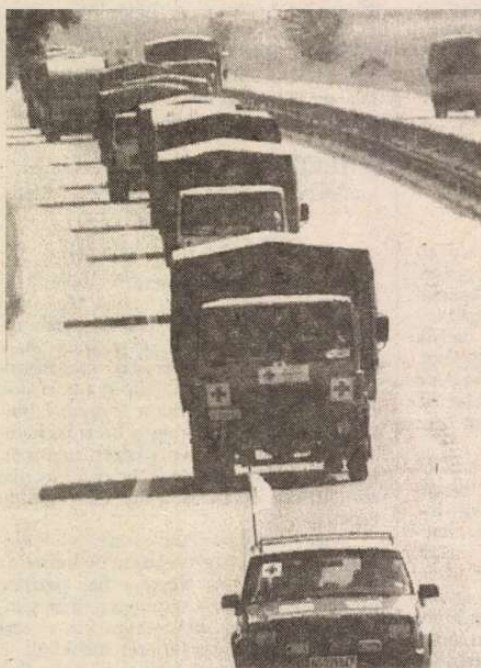
Elindult a konvoj

A szövetségi kormány a jugoszláv Vöröskereszt révén tegnap humanitárius segítyt küldött Goraždénak és Szarajevónak.