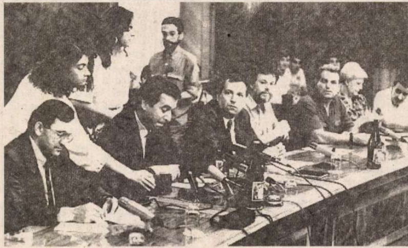
Az értekezlet résztvevői

A szerb kormányban tegnap tartották meg az első megbeszélést a parlamenti pártok, amelyek részt vesznek majd a szövetségi kormány kerekasztal-megbeszélésén. A tegnapi ülésen azonban az egyedüli konkrét eredmény az volt, hogy a résztvevők megállapodtak: a jövő hét elején ismét összegyűlnek.