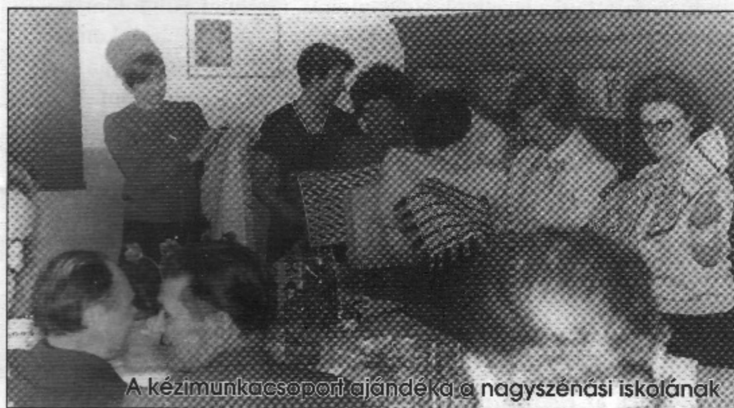
A kézimunkacsoport ajándéka a nagyszénási iskolának

ban ez így nagyon jól jött, mert mindenféle engedély, terv, jelentés sokkal könnyebben ment, ha ott voltak a községi elvtársak, ugyanis a nyolcvanas évekig a találkozók, látogatások részletes tervét legalább két helyre (nem az adóhivatalba!) be kellett adni. A találkozók után pedig jelentést. Tudtommal senkinek a haja szála sem görbült (kivéve nekem 1986-ban, amikor a Petőfi iskolák találkozójaival kapcsolatban mellékesen a nagyszénási látogatásaimat is főlemlegették, de ez más történet).