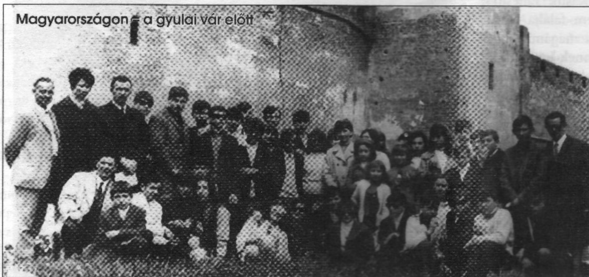
Magyarországon – a gyulai vár előtt

Megjegyzés: A cikk megjelent tíz évvel ezelőtt a Csernyei Újságban Negyven címmel. Akkor a negyvenéves jubileumra emlékeztünk, de úgy érezzük, most sem veszített időszerűségéből.