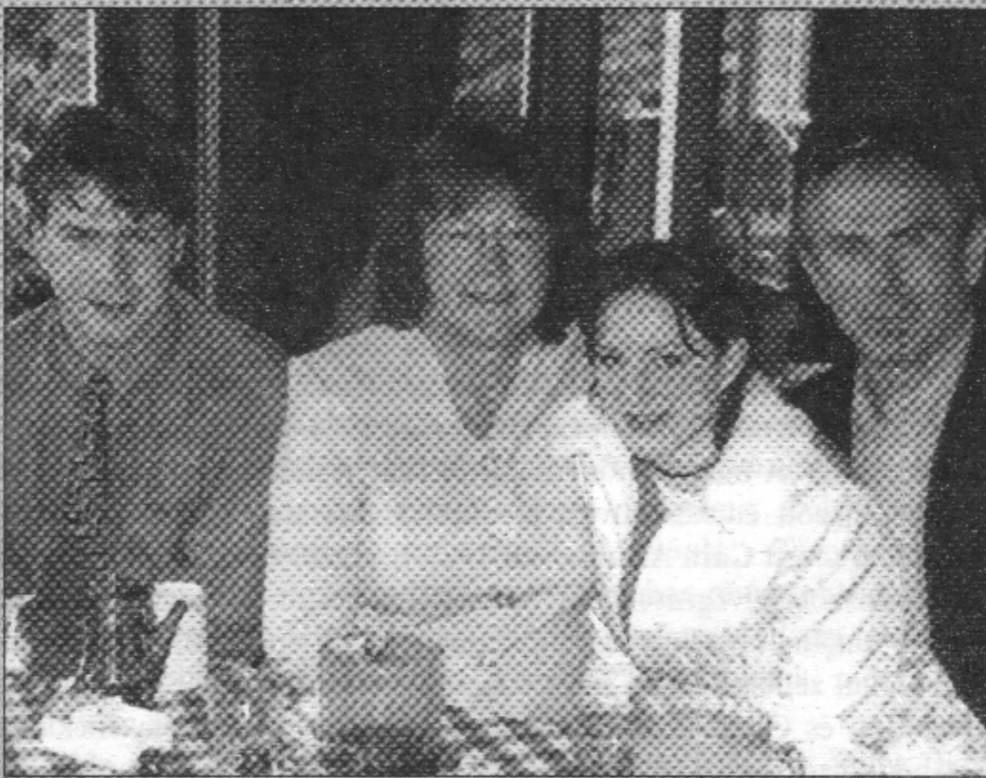
Még együtt a család (2000-ben az osztálytalálkozóra küldött levélhez mellékelve)